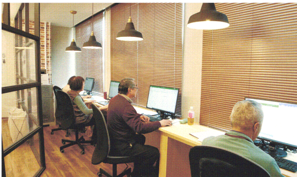
新型コロナウイルス感染拡大前のオフィスの様子。コミュニケーションを取りやすいようレイアウトが工夫されている